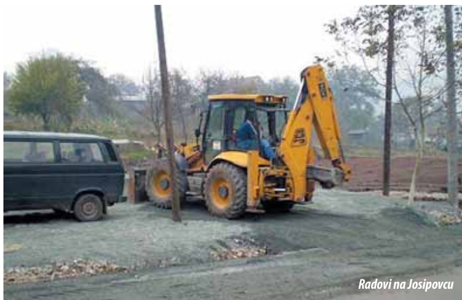
Radovi na Josipovcu

Želja sestara je kuću od čije je gradnje proteklo skoro 125 godina, od sadašnjeg rugla pretvoriti u ljepoticu, kuću koja će služiti časnim sestrama koje u Tuzli danas nemaju svoje kuće, a koja bi dobro došla i mnogima koje bi tu mogle dočekati svoju starost. Dio prostora mogao bi biti korišten kao internat, a sve u svemu, bio bi od koristi i samom gradu. Podsjetimo, u toj kući