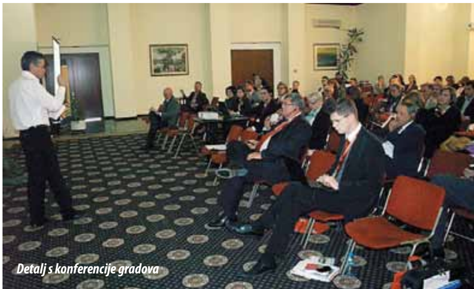
Detalj s konferencije gradova

„Mi se želimo umrežiti sa svim europskim gradovima i zajednički rješavati određene probleme. Problem nekih gradova i građana jest centralizacija koja onemogućava da zadovoljite sve potrebe svojih građana. Naš