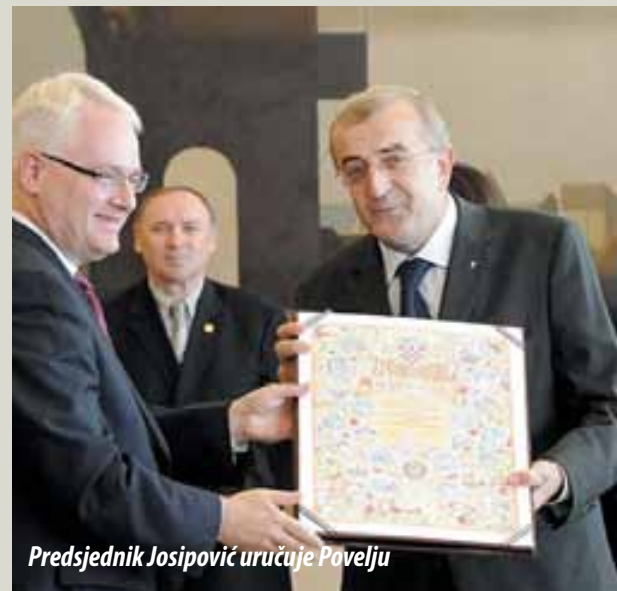
Predsjednik Josipović uručuje Povelju

„Ovo je veliko priznanje Napretku, svim članovima, ali i svim našim prijateljima i dobročiniteljima, za sav naš trud na području kulture, očuvanja i njegovanja nacionalnog i kulturnog identiteta. Na-