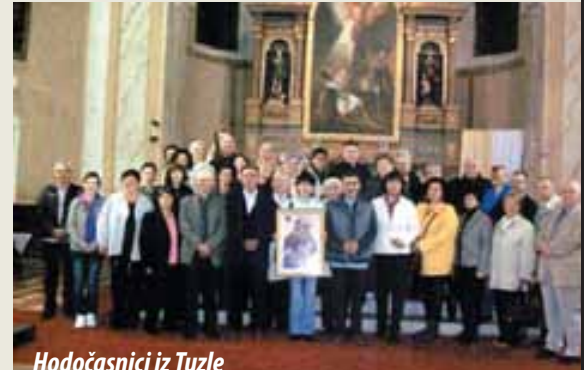
Hodočasnici iz Tuzle