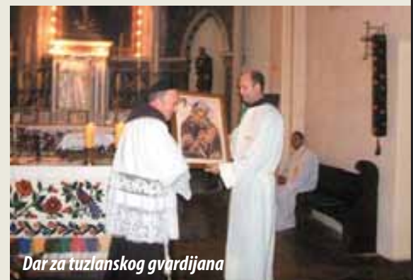
Dar za tuzlanskog gvardijana

Tijekom cijelog putovanja u autobusu se osjetila duhovnost, pa je put bio praćen molitvom i pjesmama Majci Božjoj. Posebnu radost su nam pridonijeli domaćini na dočeku pred franjevačkim samostanom. U 17 sati je upriličen ručak i osvježenje za hodočasnike, a zatim se prešlo u crkvu gdje se prije svete mise molila krunica.