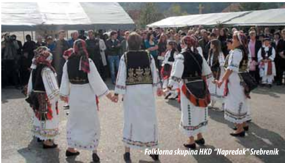
Folklorna skupina HKD "Napredak" Srebrenik